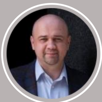
специальный гость КАМИЛЬ БАХТИЯРОВ, Ректор корпоративного университета клиники Семейная, профессор, д.м.н.