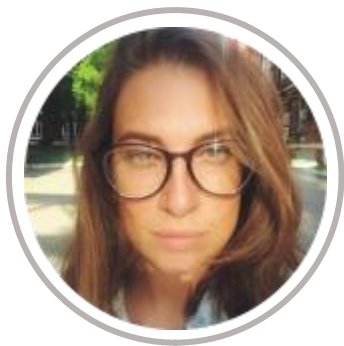
ЯНА МАРЧУК, РБК Здоровье